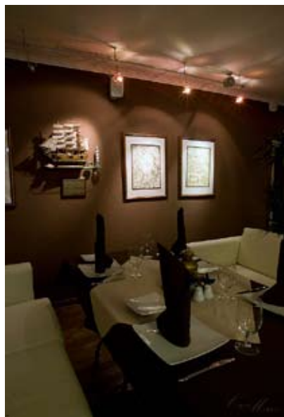
Фотосессия ресторан Карте Марин