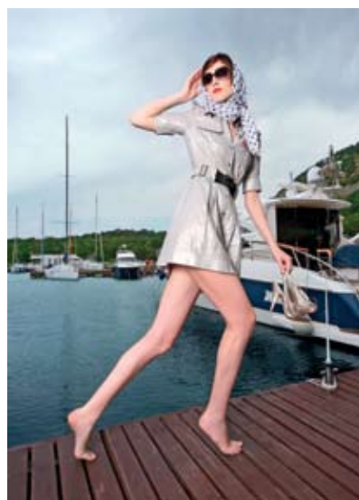
фотосессия бутик Ангел, яхт клуб Утриш, 2008