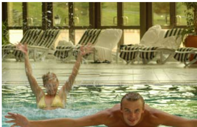
фотосессия для СПА - центра курортного комплекса Надежда, Август 2005