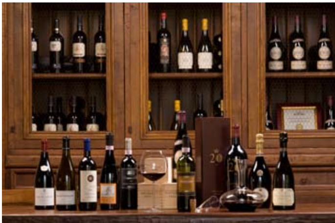
Фотосессия Палаццо Сенека