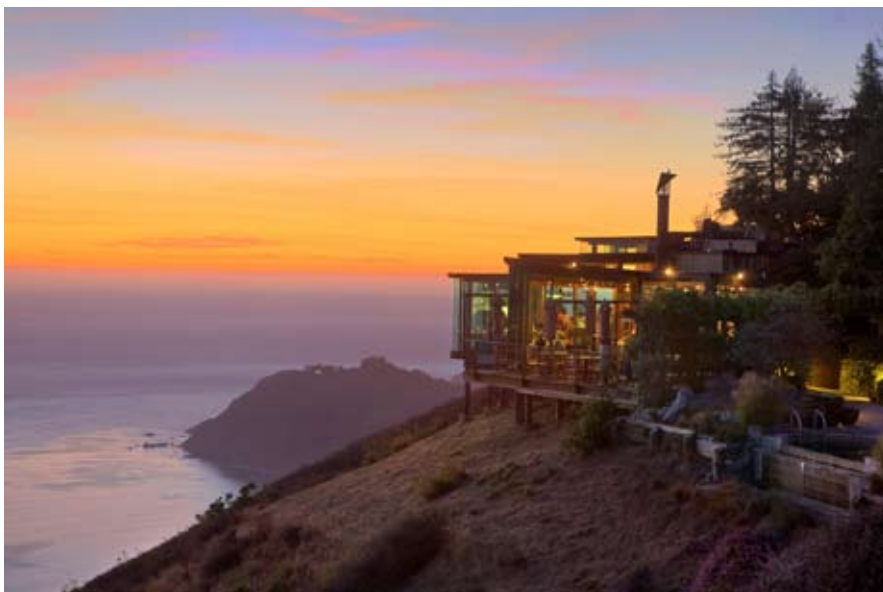
пример фотографий, Post Ranch Inn 5*, Калифорния