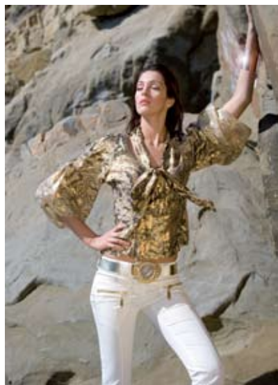
фотосессия Gizia, коллекция весна-лето 2008