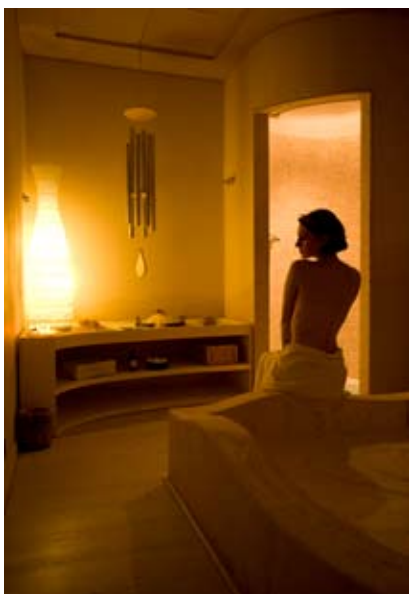
Фотосессия курорт Фонтеверде