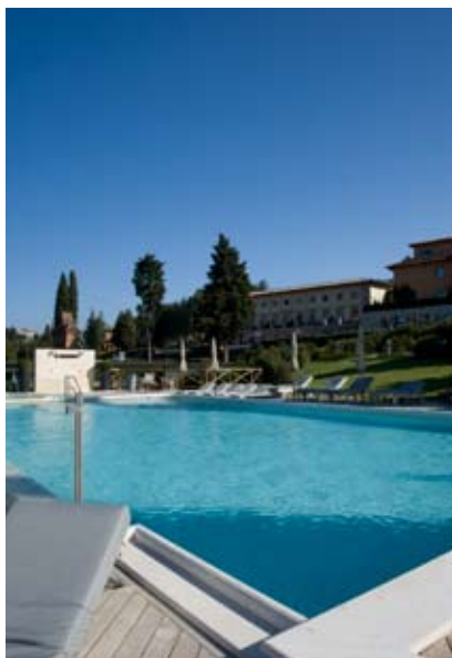
Фотосессия курорт Фонтеверде