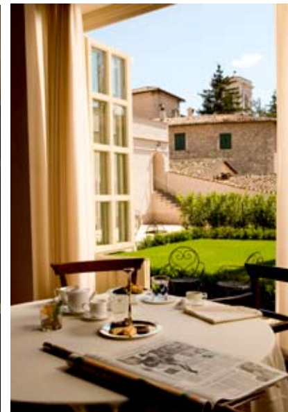
фотосессия Палаццо Сенека